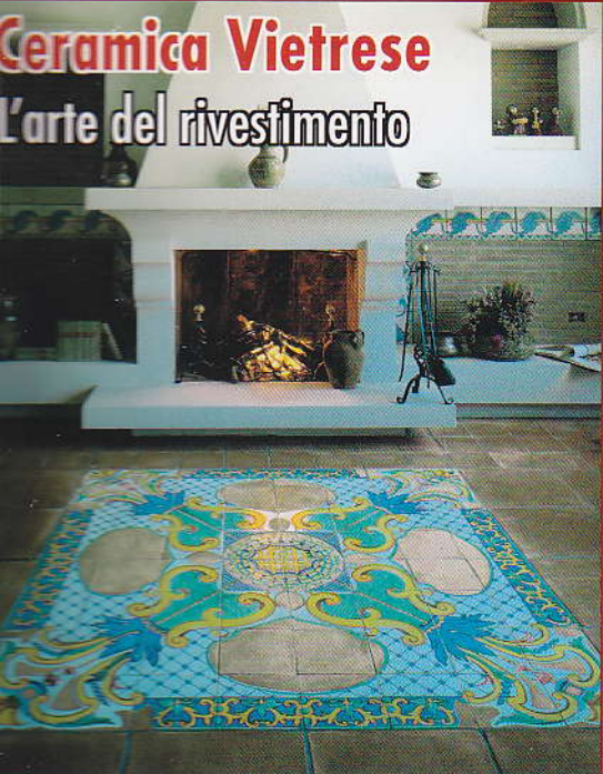
Ceramica Vietrese L'arte del rivestimento