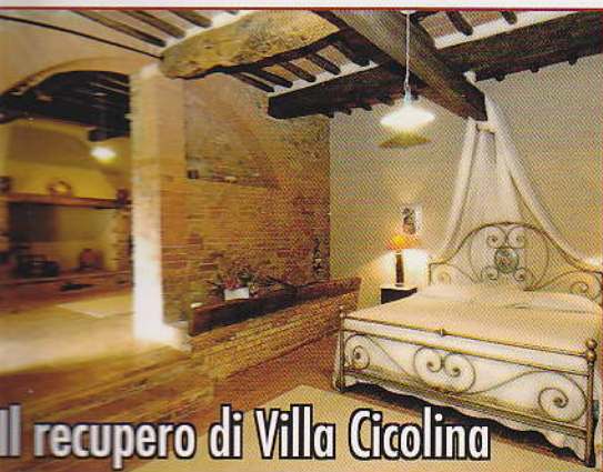
Il recupero di Villa Cicolina

TATTILO EDITRICE S.p.A. - ANNO V - N. 27 Bimestrale - Maggio/Giugno 2009